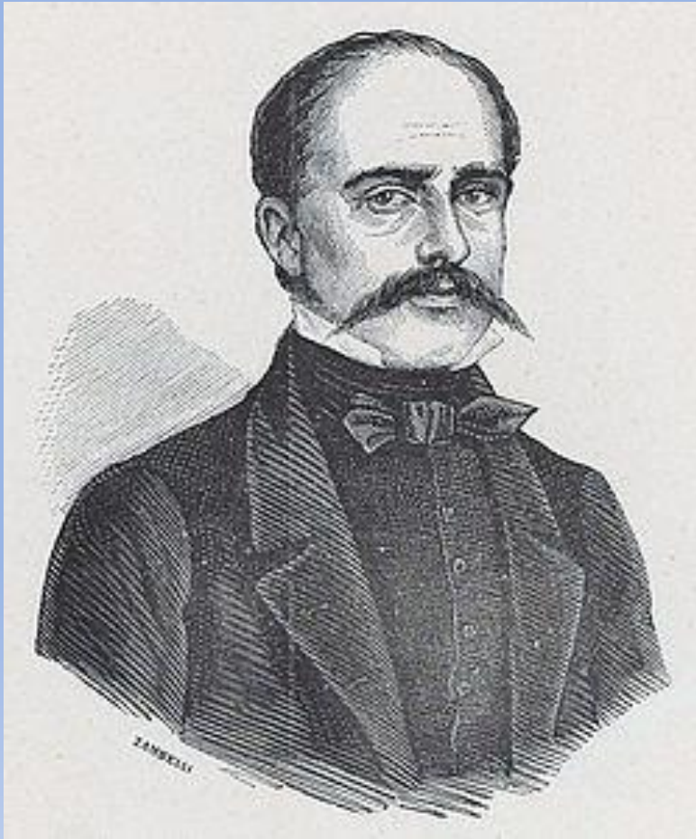
Francesco Arese Lucini (1805 – 1881)