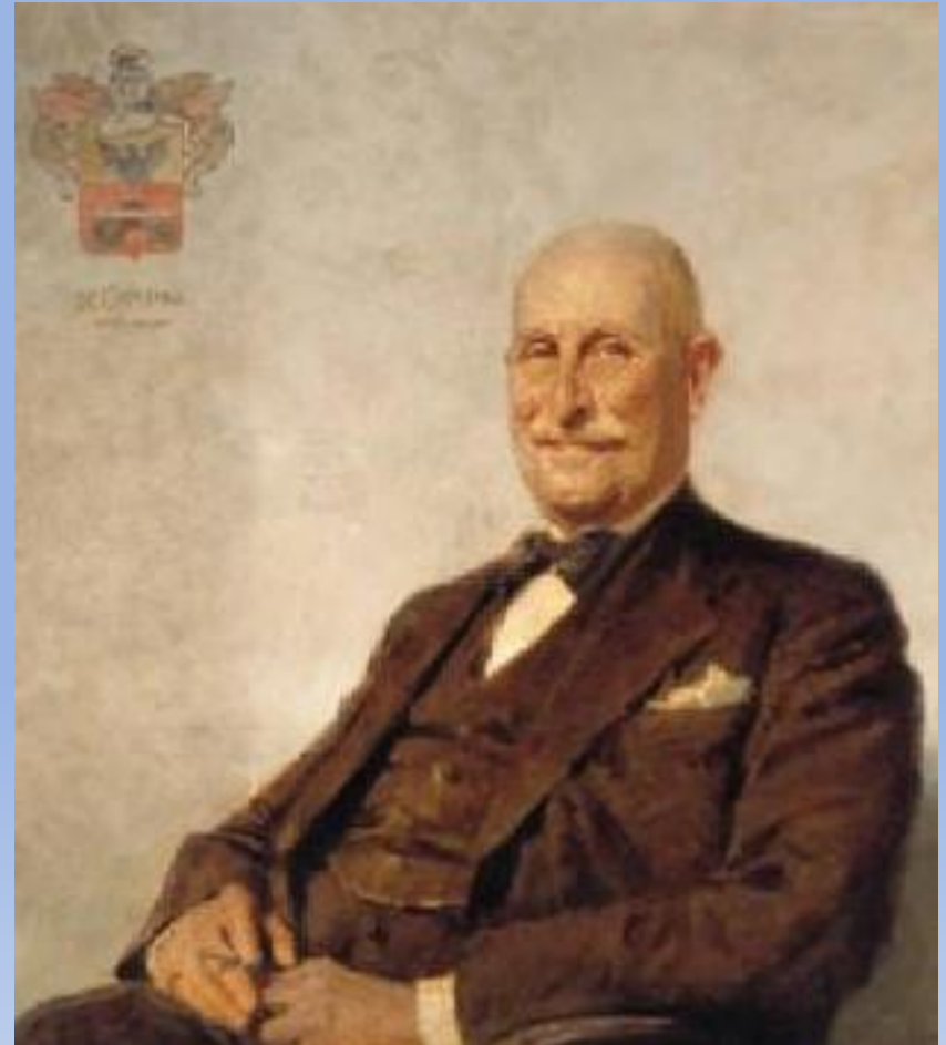
Guido de Capitani da Vimercate (1859 – 1942)