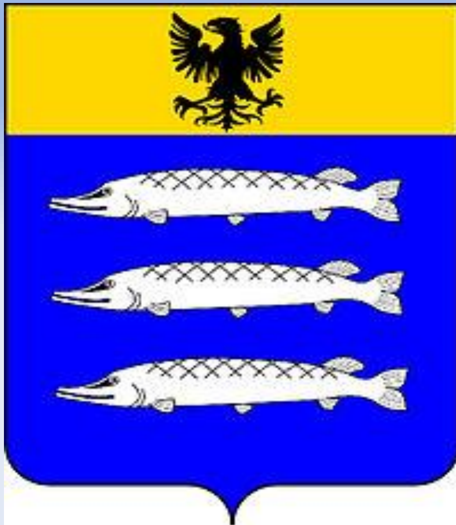
Stemma di don Giulio Lucini, 1° Marchese di Besate (dal 1633) e Signore di Osnago (dal 1651), Sindaco e procuratore speciale di Osnago nel 1647