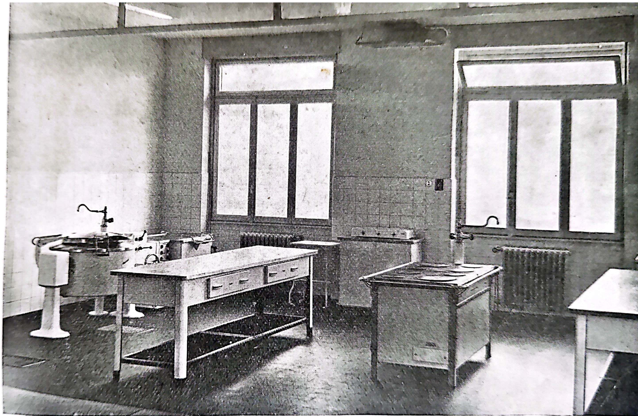
La nuova cucina dell'Ospedale