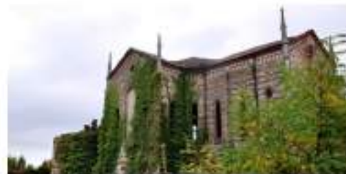
Il Vecchio Oratorio

AVVIAMO NEL PRIMO ANNO UNO STUDIO PER UN UNICO GRANDE PROGETTO DI REVISIONE URBANISTICA DI TUTTO IL CENTRO PER DISEGNARE I PROSSIMI 20 ANNI DI MERATE