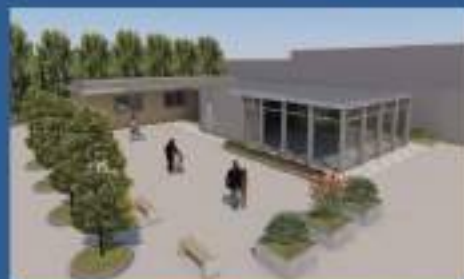
SPAZIO POLIFUNZIONALE PER EVENTI*