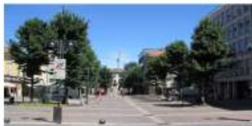
La Piazza e il Centro