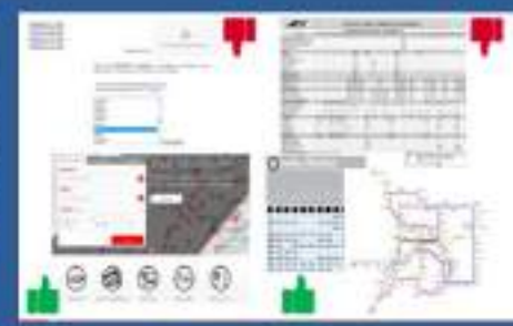
FACILE UTILIZZO E COMUNICAZIONE