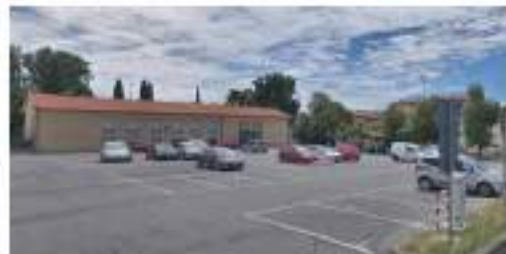
Piazza Don Minzoni