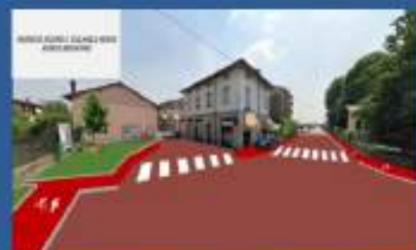
MESSA IN SICUREZZA INCROCIO E CICLABILE VERSO RONCO