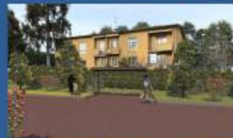
PENSILINA PER AUTOBUS