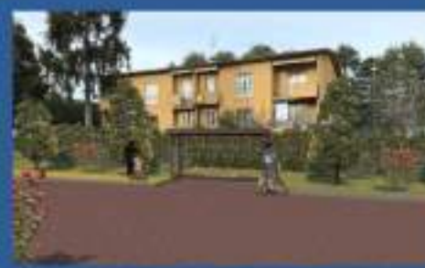
RIFACIMENTO PENSILINE NEL TERRITORIO