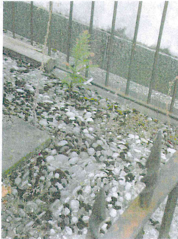
Particolare dei corridoi perimetrali in acciottolato e della recinzione in ferro.