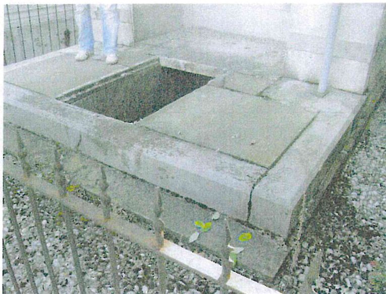
Ingresso ai loculi.