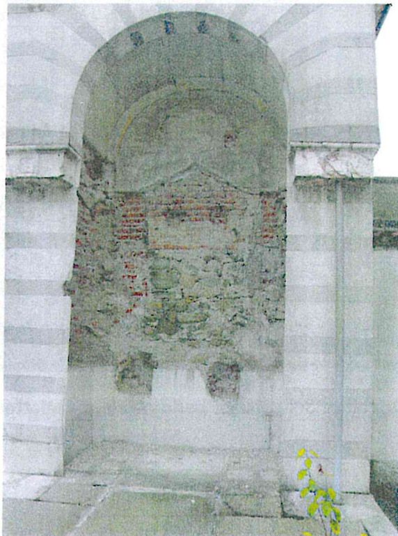
Valutazione tomba di famiglia Rilievo Fotografico